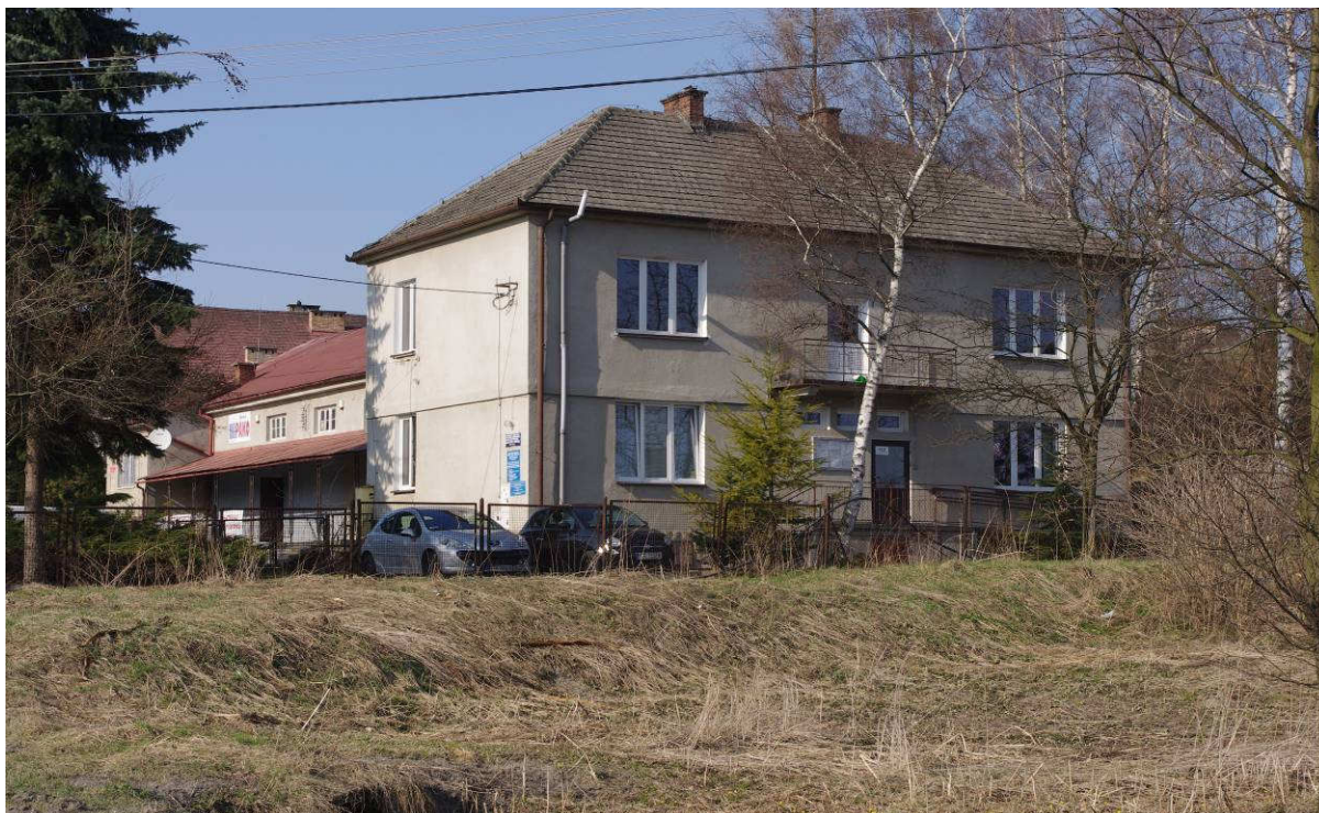
Wiejski Ośrodek Zdrowia