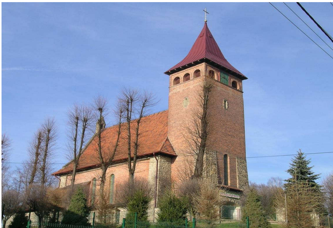
Kościół Przenajświętszej Trójcy