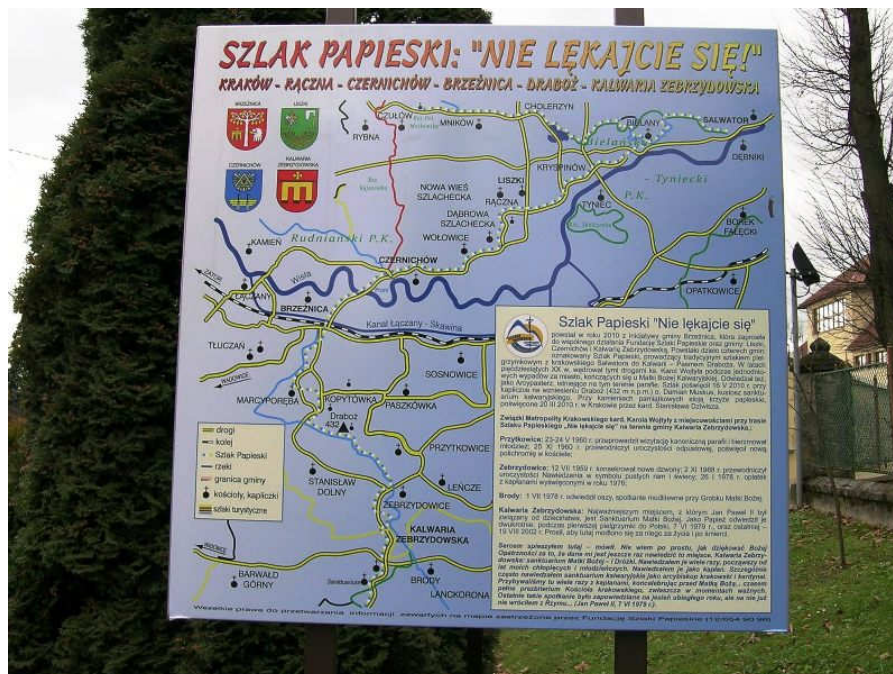
Tablica informacyjna Szlaku Papieskiego przy kościele.

Przez Przytkowice przebiega także Szlak Papieski "Nie lękajcie się!" Kraków-Salwator – Brzeźnica – Kalwaria Zebrzydowska. Upamiętnia on piesze wędrówki, jakie odbywał ks. Karol Wojtyła – późniejszy papież Jan Paweł II. Szlak biegnie wzdłuż zachodniej granicy parafii. Uroczystość otwarcia i poświęcenia Szlaku Papieskiego miała miejsce przy kaplicy Miłosierdzia Bożego na Drabożu w niedzielę 16 maja 2010 roku.