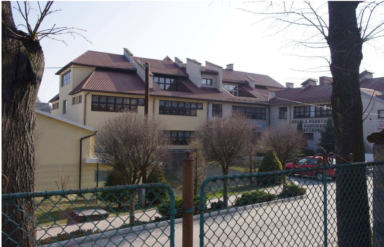
Zespół Szkół Nr 3 im. Tadeusza Kościuszki