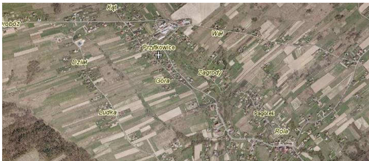
Mapa położenia Przytkowic

Budynki rozmieszczone są wzdłuż ciągów drogowych. Miejscowość ze względu na piękne pejzaże i spore zalesienie stanowi świetny teren rekreacyjny.