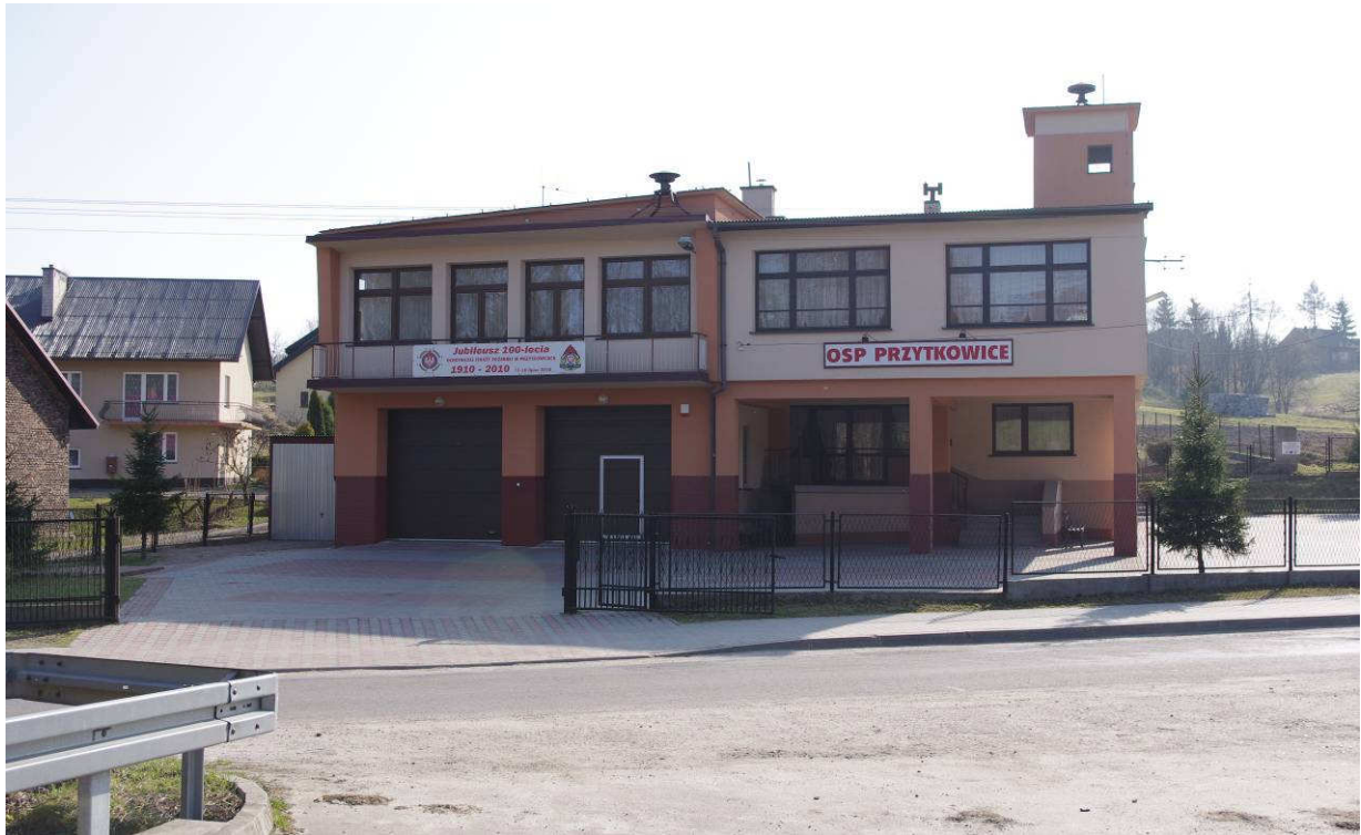
Remiza OSP Przytkowice