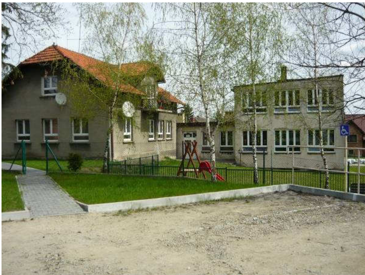
Filia Szkoły Podstawowej nr 6 Leńcze w Podolanach