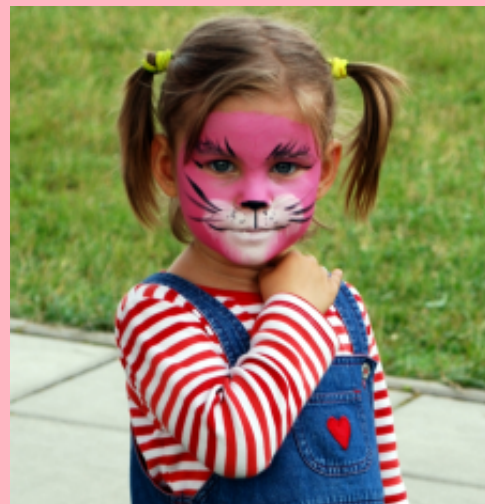
Fotografie z Dni Kalwarii 2013

28 lipca Animacje dla dzieci z CKSiT na kalwaryjskim Rynku (szczudlarze, żonglerzy, malowanie twarzy, zabawy chustą animacyjną i inne)